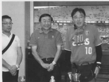
平成27年7月29日(水) 点鐘18:30 さいたまスタジアム ビューボックス