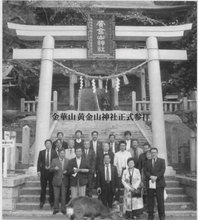
金華山 黄金山神社正式参拝