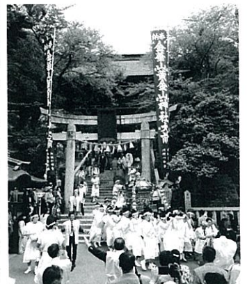
金華山黄金山神社(正式参拜)

4月19日の親睦旅行例会には多数のお申し込みをいただきありがとうございます。まだ申し込みをされていない方は本日受け付けていますのでよろしくお願ひいたします。登録料は4月の例会時にお願ひ致します。