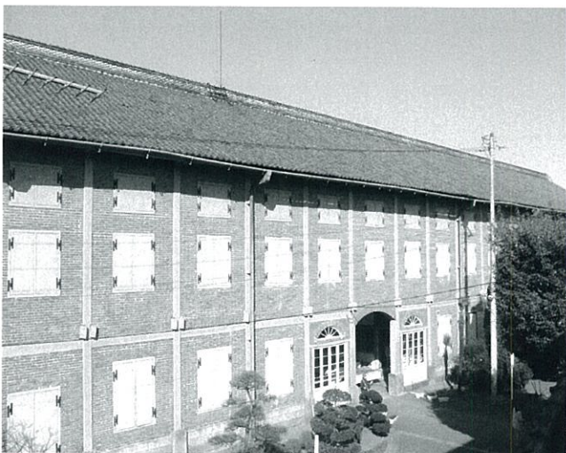
富岡製糸場東繭倉庫 (群馬県富岡市)

この年になりまして学ばなければならないことが大変多くありまして多忙な毎日を過ごしております。