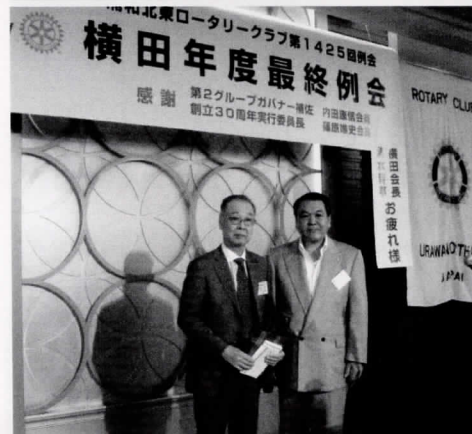
在籍10年以上で退会された会員に記念品贈呈